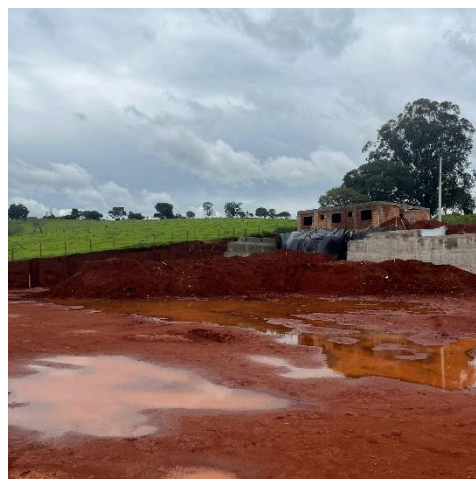
Terreno após terraplenagem.